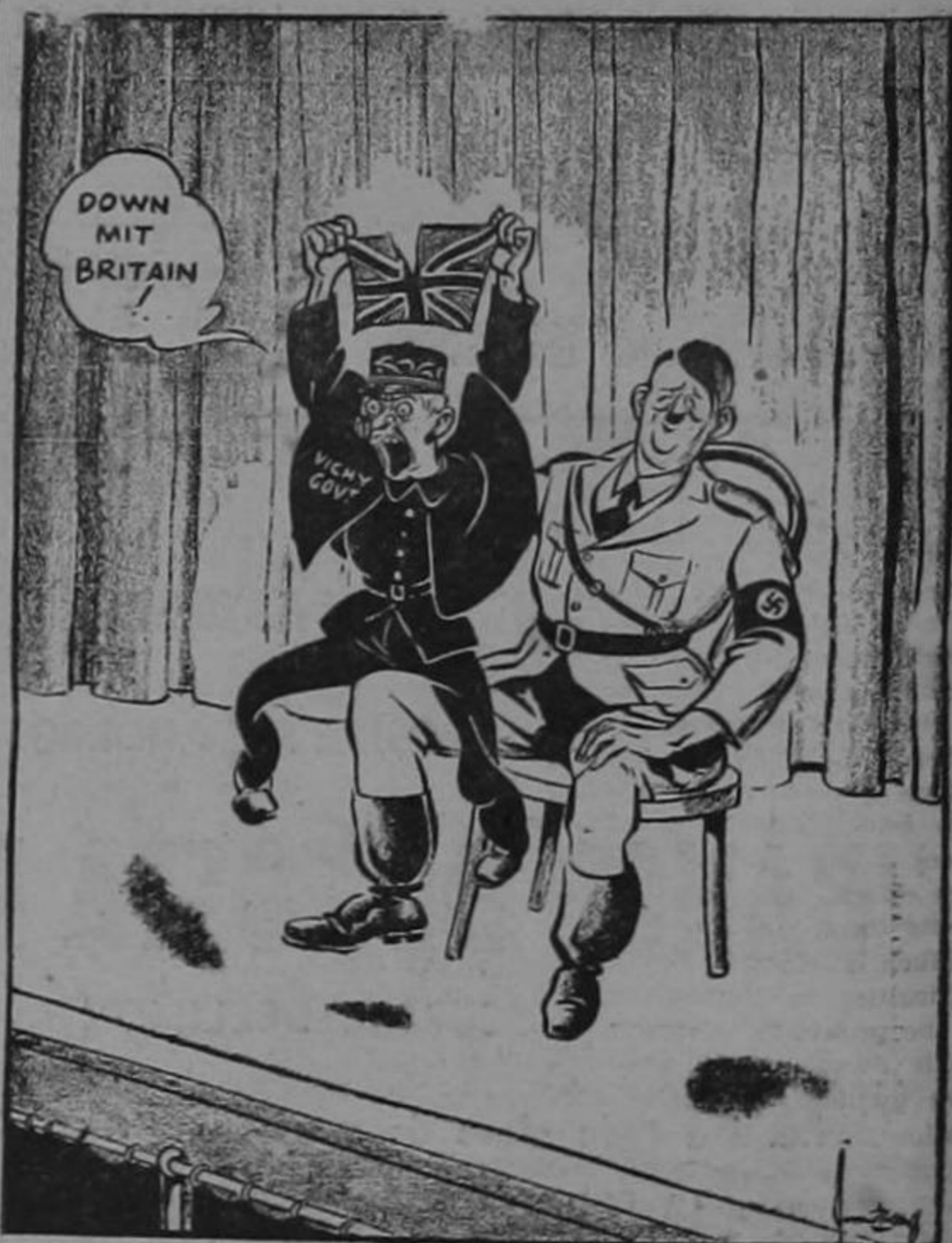
SEZ ME Cartoon from the Melbourne Argus. Not available in Australia.